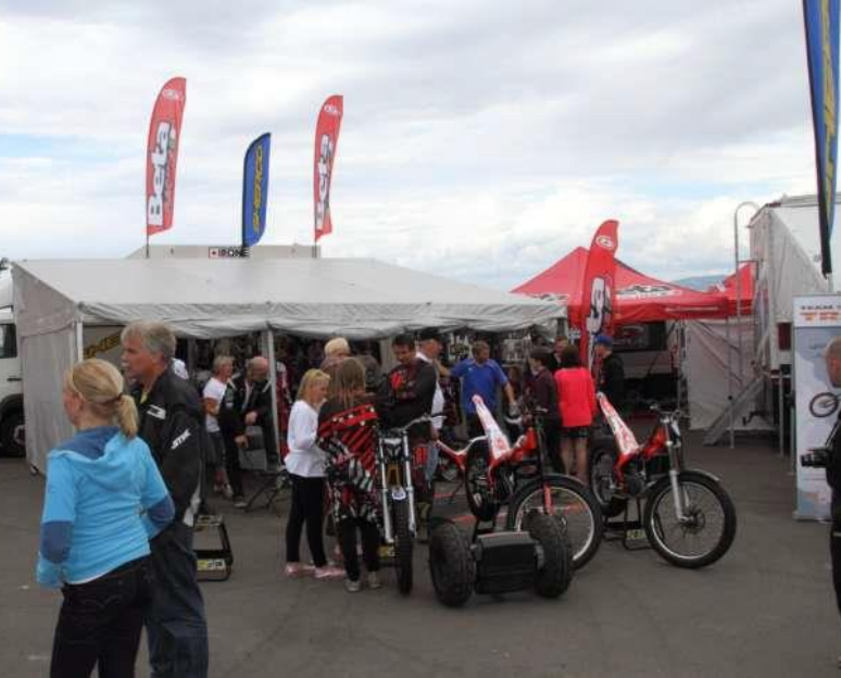
Utstyslevrandørerne Motorsyklisten og Tanberg MC fikk fine utstillingsplasser i depote.