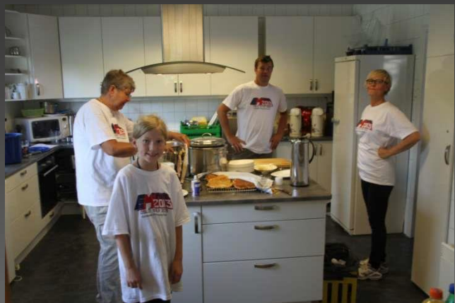
Kokkene i gang på "Stor" kjøkkenet til OMS. Maten kunne nytes i Kafèen eller ute i teltet til NMF's bil.