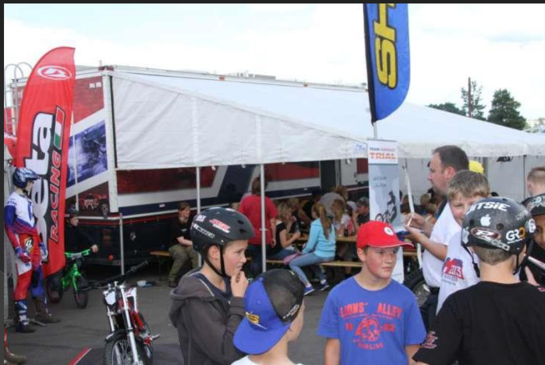
NMF bil og telt.